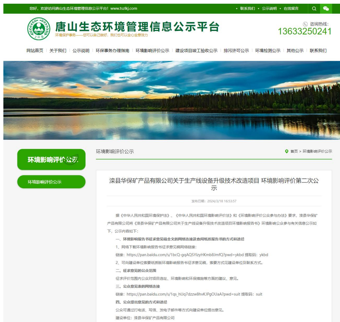
图 3-1 公众参与第二次网上公开截图

2024年03月18日至2024年03月29日滦县华保矿产品有限公司通过《唐山生态环境管理信息公示平台》网站公示《唐山生态环境管理信息公示平台》属于项目所在地公共媒体，符合《环境影响评价公众参与管理办法》的要求。